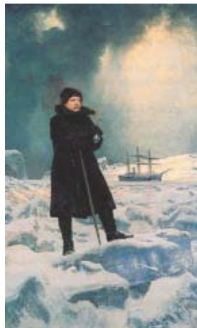
Adolf Erik Nordenskiöld (1832-1901)