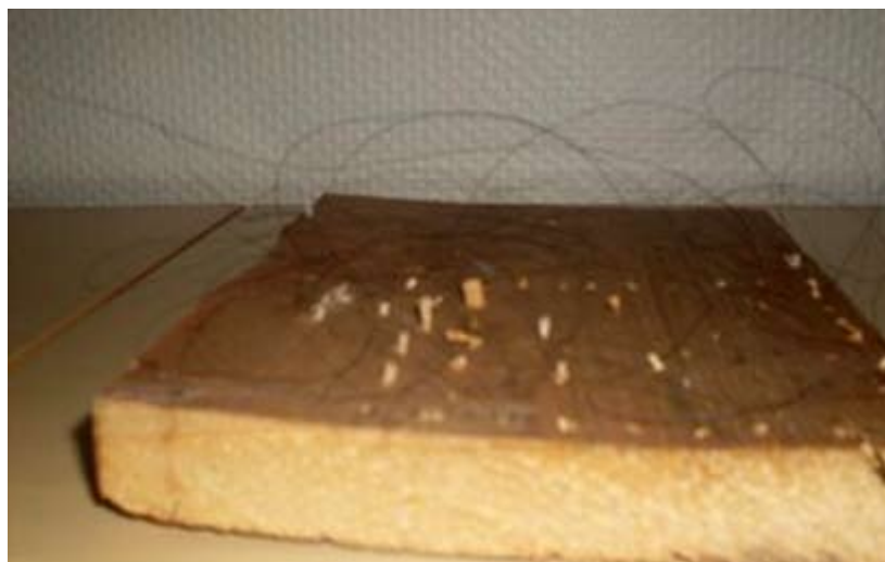
Fångstbräda för kramsfågel

Att kramsfågel var uppskattat kan man förstå av talesättet om de "stekta sparvarna" som inte flyger in i munnen.